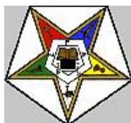
Ordre de l'Etoile Orientale (OES)

Organisation maçonnique d'adoption. Elle fut fondée en 1873. La qualité de membres est limitée aux Maçons, à leurs épouses et parenté féminine. Il fut à l'origine créé pour être un degré supplémentaire dans l'Ordre de l'Etoile Orientale (OES), mais fut rejeté par celui-ci. Il fut alors constitué en organisation distincte. Jusqu'en 1921, ses membres devaient être affiliés à l'Ordre de l'Etoile Orientale. L'assemblée est une Cour et les Officiers Présidents, homme et femme, sont le Royal Patron Royal et la Royale Matrone.